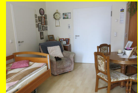
Zimmer mit eigenen Möbeln

Diese Grundausrüstung können Sie soweit räumlich möglich, mit eigenen Möbeln und sonstigen Einrichtungsgegenständen ergänzen, um dem Zimmer eine persönliche Note zu verleihen. Ihrem Wunsch nach Wohnen in einem Einzel- oder Doppelzimmer wird erfüllt, soweit es die aktuelle Belegungssituation zulässt.