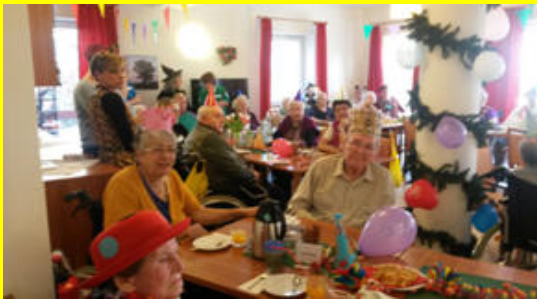
Feier im Haus Sophie

Kommen Sie und überzeugen Sie sich selbst.