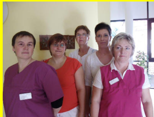
Mitarbeiter/innen der Pflege

Unser Ziel ist es, die vorhandenen Fähigkeiten unserer Senioren solange wie möglich zu erhalten und ihnen in Gesellschaft die Freude eines schönen Tages zu bereiten.